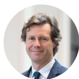
JEAN-PHILIPPE TASLÉ D'HÉLIAND Président ODDO BHF Banque Privée