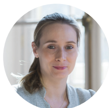
JULIANE FRANCE Tenue de compte & conservation

La solidité financière du Groupe se confirme avec des capitaux propres supérieurs à 866 millions d'euros et un ratio de solvabilité de 16,6 %.