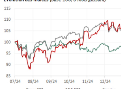
Evolution des indices (base 100, 6 mois glissant)