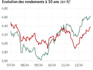
Evolution des rendements à 10 ans (en %)