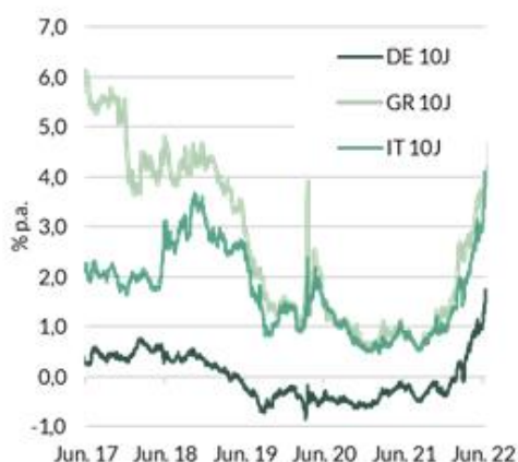
Abb. 2: Veränderung der Renditedifferenz 1) und Staatsverschuldung im Euroraum